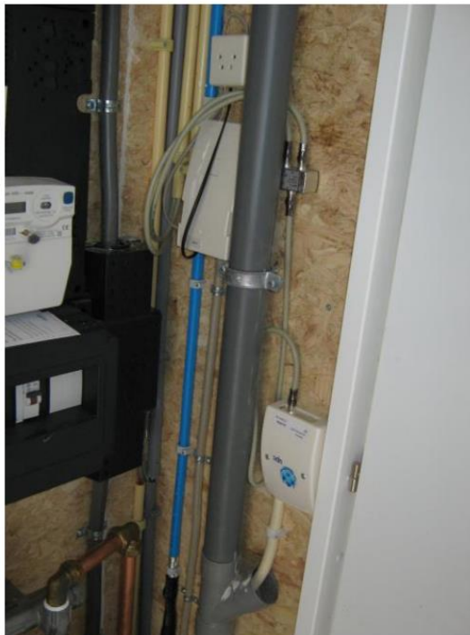
Data-aansluiting en telefoon