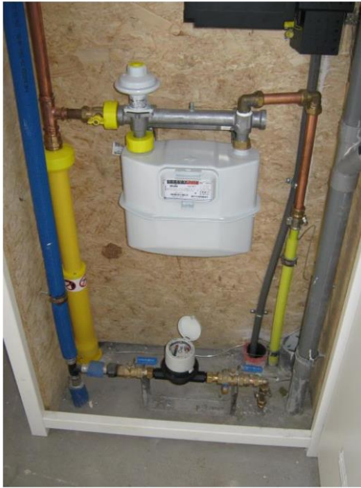
De meterkast met Water- en gasmeter