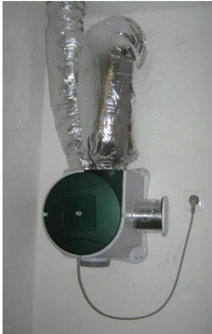
Unit mechanische ventilatie