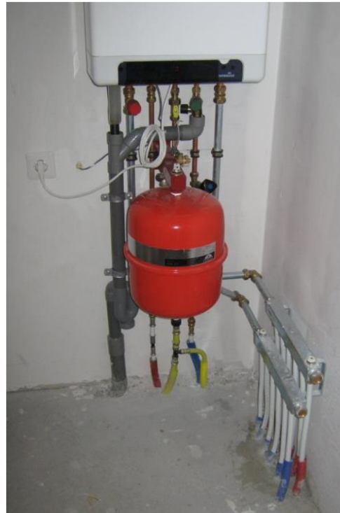
Expansievat en verdeler