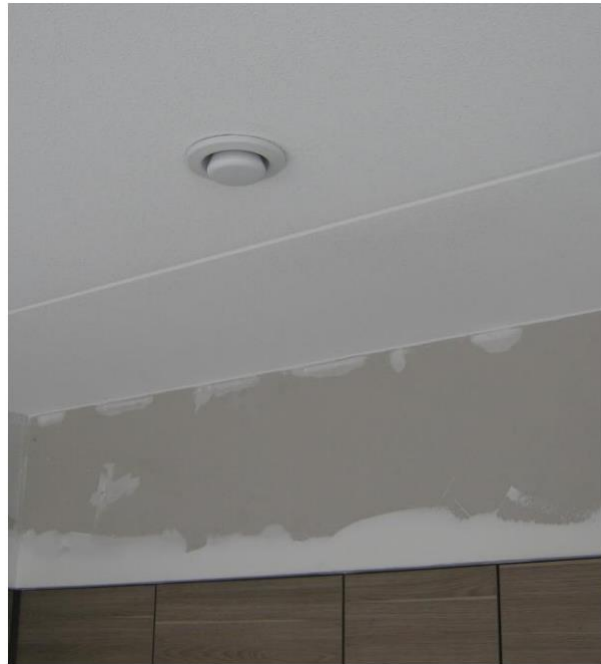
Ventiel mechanische ventilatie