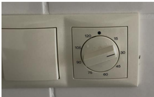
Plaatje timer kookplaat boven het aanrechtblad.

De kookplaat is aangesloten via een timer, deze is boven het aanrechtblad geplaatst. Wilt u de kookplaat inschakelen, dan moet u ook de timer inschakelen. De timer is in te schakelen van 15 tot 120 minuten (2 uur).