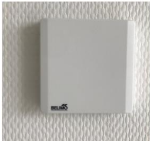
Plaatje CO 2 sensor (geplaatst in de woonkamer, slaapkamer en badkamer)

Uw ventilatie systeem werkt geheel automatisch. In de badkamer is een vochtsensor aangebracht. Deze zal de ventilatie (tijdelijk) verhogen bij het douchen of als de luchtvochtigheid hoog is in het vertrek. In de woon- en slaapkamers zijn CO 2 sensoren aangebracht. Deze meten de CO 2 (zuurstof) concentratie in het vertrek en verhogen de ventilatiecapaciteit indien deze waarde te hoog wordt. Dit gaat geheel automatisch.